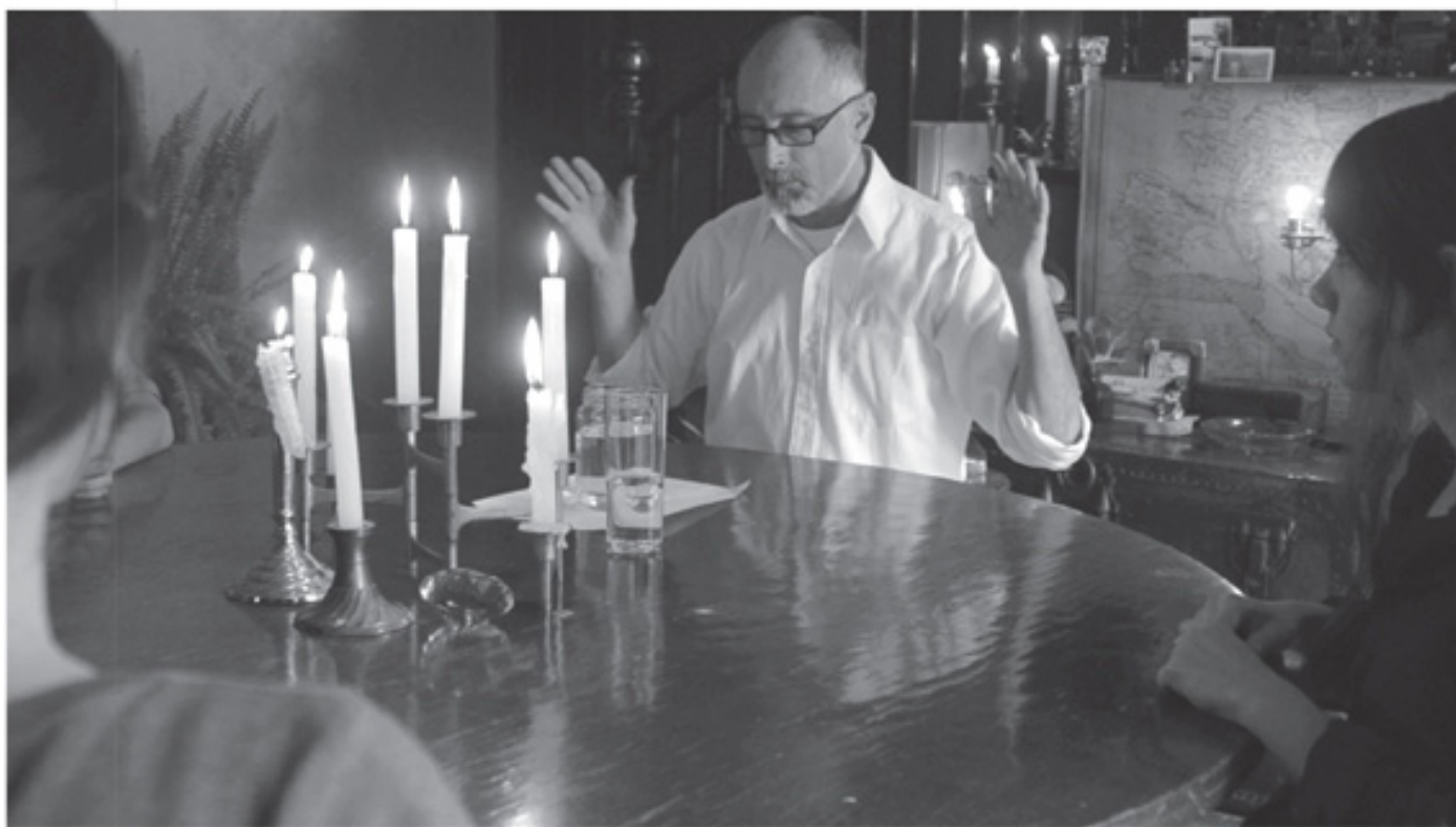
Semiotic and Chaos , 2011.