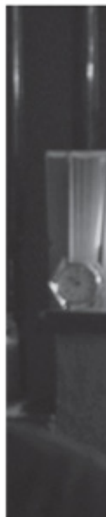
Semiotic and Chaos, 2011

Video a dos canales que muestra una sesión espiritista: cuatro chicas desean saber qué ocurrió un par de años atrás con su mejor amiga, asesinada por un comando de delincuentes en un bar de Torreón. Las jóvenes fueron conectadas vía Facebook, plataforma donde Jiménez Ortiz ha abierto cuentas para personas asesinadas en el norte de México.