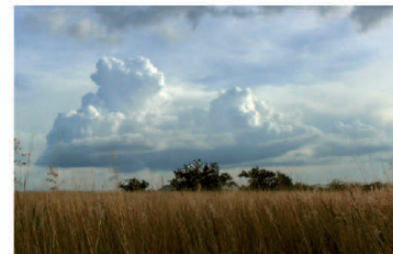
Efectos de familia, 2008. Edgardo Aragón.

El Taller De martes a viernes, de 16 a 21 h. Sábados y domingos, de 12 a 21 h. Acceso libre